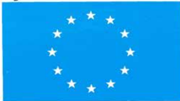
EGs symbol med en stjärna för varje medlem. Man tar inte emot fler medlemsansökningar före 1993 men sedan kanske Sverige får egen stjärna.

Den 1 januari 1993 ska enligt EGs mål alla handelshinder länderna emellan vara borta. EFTA-länderna, däribland Sverige strävar efter att så långt möjligt harmonisera sig med EG. En överlevnadsfråga för exporterande företag.